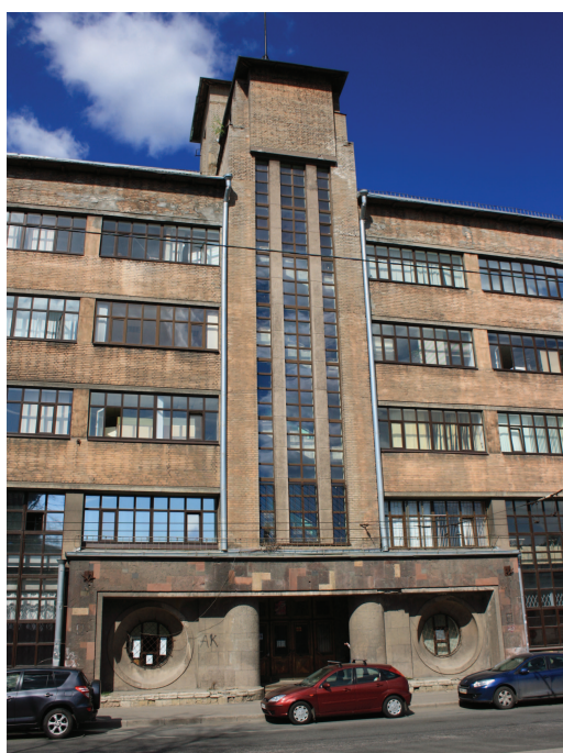
Рис. 3. Современный вид фасада 2-го корпуса НИИПТ

нечными овальными балконами, размещавшимися вокруг огромного центрального зала, что создавало неповторимую уникальную картину. На наш взгляд, было построено по-своему красивое производственное здание, аналогичных решений лабораторий ТВН с выходом из камеральных помещений прямо на балкон испытательного зала, по-видимому, не было и нет.