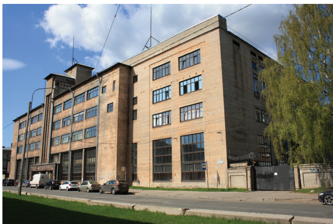
Рис. 2. Современный вид 2-го корпуса НИИПТ со стороны Физико-технического института