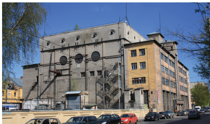
Рис. 1. Современный вид 2-го корпуса НИИПТ со стороны «Позитрона»

Таким образом, в 1934 г. в Ленинграде, в Яшумове переулке (ныне ул. Курчатова), был построен специально для высоковольтных целей пятиэтажный дом с большими круглыми окнами на первом этаже, с двумя примыкающими большими производственными дворами (западным и восточным), т. е. примерно то, что мы можем увидеть и сегодня (рис. 1–3). Третий, четвертый и пятый этажи здания со служебными комнатами сотрудников по внутреннему периметру были окружены беско-