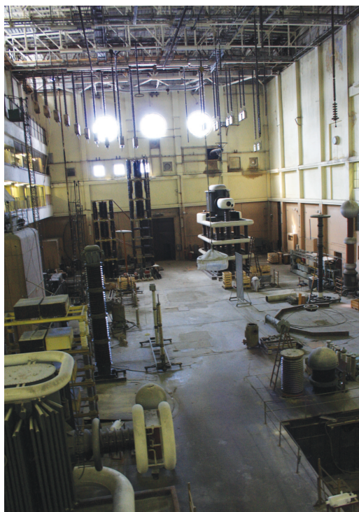
Рис. 7. Большой высоковольтный зал 2-го корпуса НИИПТ (современный вид)

некоторых подразделений привели к тому, что после распада СССР (в 90-е гг. минувшего века) корпус стал активно заселяться сотрудниками арендующих помещения НИИПТ организаций. Такая же судьба сложилась в наши дни у высоковольтного корпуса ЛПИ (СПбПУ).