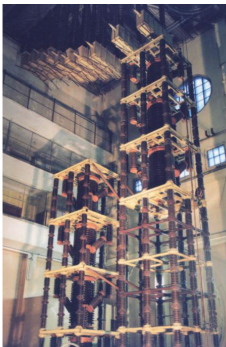
Рис. 5. Испытательная установка постоянного тока 1200 кВ, 0,3 А

Установка нового проходного изолятора 750 кВ (стенного ввода напряжения в здание) после капитального ремонта со сносом северной и западной частей внутренних балконов позволила поднимать в большом зале переменное напряжение до 1000 кВ (одна ступень каскада плюс такой же трансформатор в зале). Выше поднимать значение напряжения не позволяли габариты здания, в первую очередь промежутков от испытательного трансформатора до стен. В это же время силами НИИПТ была спроектирована, изготовлена и установлена в большом зале уникальная для того времени мощная испытательная установка постоянного напряжения 1200 кВ, 0,3 А (рис. 5). В результате в зале можно было проводить испытания гирлянд изоляторов и внешней изоляции электрооборудования в загрязненном и увлажненном состоянии натуральных размеров. Были проведены испытания при переменном и постоянном напряжениях длинных гирлянд изоляторов (длиной до 10 м) и высоких опорных конструкций (длиной до 8 м). Для 70-х гг. прошлого века полученные данные являлись определенным рекордным достижением и были использованы при выборе изоляции первых в мире электропередач 1150 кВ переменного тока и \pm 750 кВ постоянного тока. За рубежом изоляционные конструкции примерно такой же длины только в начале XXI в. впервые испытаны в сооруженных в Китае новых испытательных центрах ультравысокого напряжения.